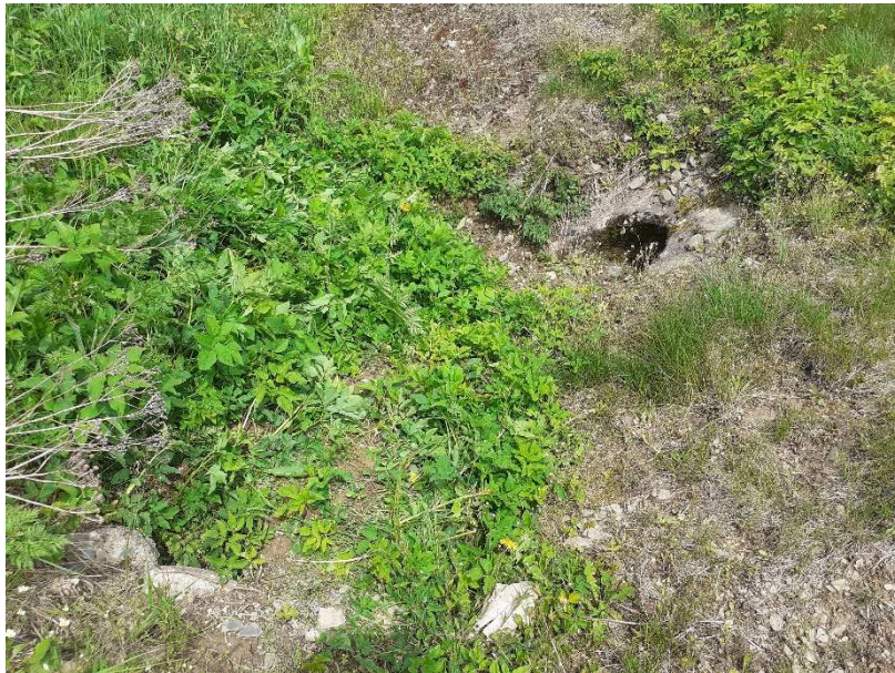
Foto č.3 - Propustek v km 35,061 - Pohled na vtok