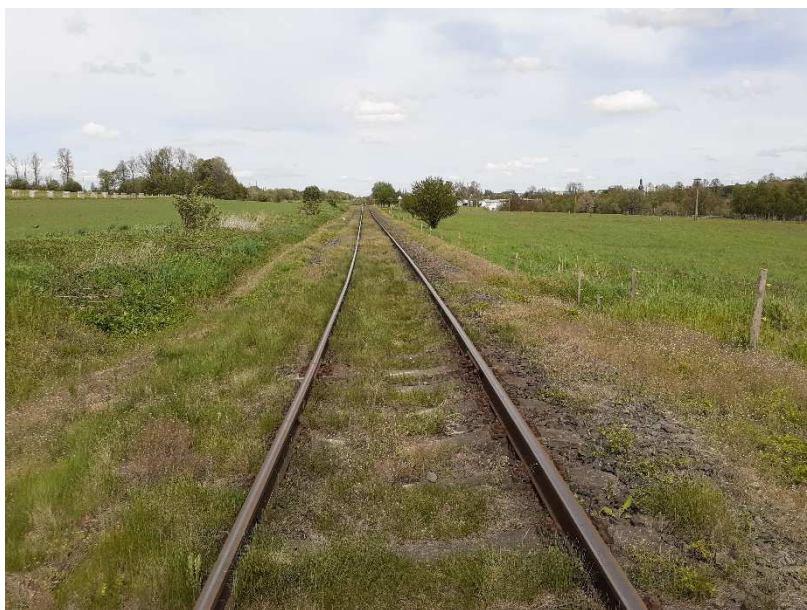
Foto č.2 - Propustek v km 35,061 - Pohled na trať - pohled proti směru staničení