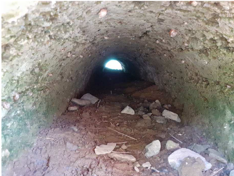
Foto č.5 - Propustek v km 35,061 - Pohled do propustku