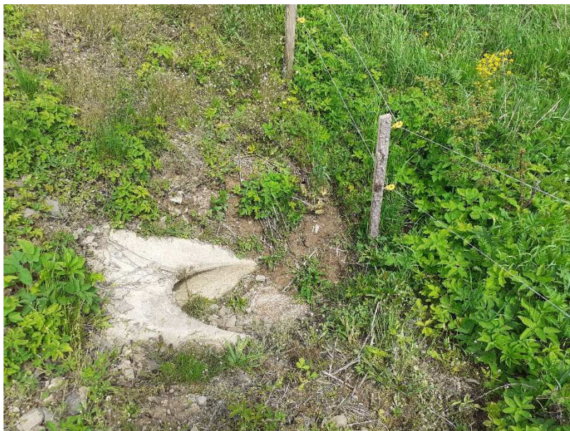
Foto č.4 - Propustek v km 35,061 - Pohled na výtok