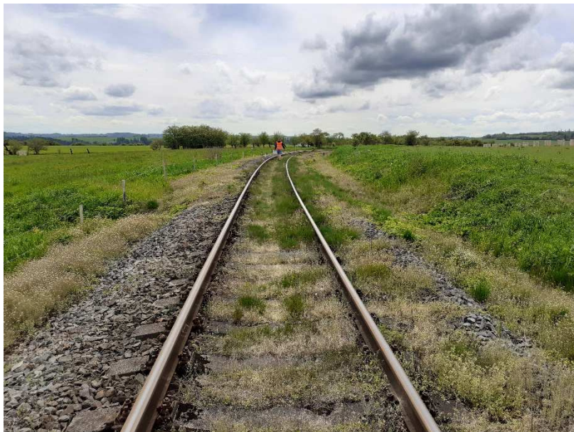
Foto č.1 - Propustek v km 35,061 - Pohled na trať - pohled po směru staničení